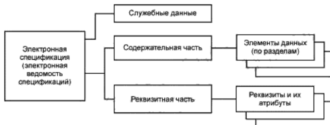
Рисунок 1 — Обобщенная структура ЭСП и ЭВС (верхнего уровня)

4.6 ЭСП (ЭВС), как правило, следует оформлять с применением ЭП (при наличии в АС средств, обеспечивающих проведение проверки подлинности ЭП). В этом случае порядок использования ЭП и источник сертификата ЭП устанавливаются стандартом организации — разработчика ЭСП (ЭВС).