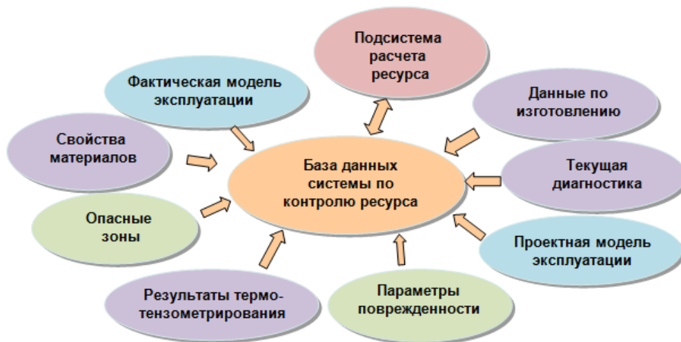
Рисунок 1 - База данных системы по контролю ресурса

База данных системы формируется под каждую РУ и обеспечивает хранение следующей информации: